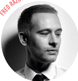
FRED RAZON - MAGICIEN

Magicien pickpocket reconnu, Fred Razon se distingue par son art du détournement, sa précision gestuelle et son humour élégant. Spécialiste du close-up, du mentalisme et de l'illusion scénique, il s'est produit dans les plus grands cabarets parisiens (Paradis Latin, César Palace...), ainsi qu'à l'international avec son numéro lumineux « Laserman ». Il est régulièrement invité sur les plateaux de télévision (Diversion, La France a un incroyable talent, Vivement dimanche), et collabore aussi bien avec des marques de luxe que des productions audiovisuelles.