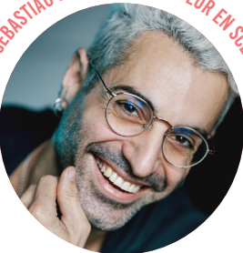
SEBASTIAO SARAMAGO - METTEUR EN SCÈNE / COMPOSITEUR

Artiste aux talents multiples, sur et hors scène depuis plus de 20 ans, Sebastiao joue, dirige, compose ou écrit pour tous les genres.